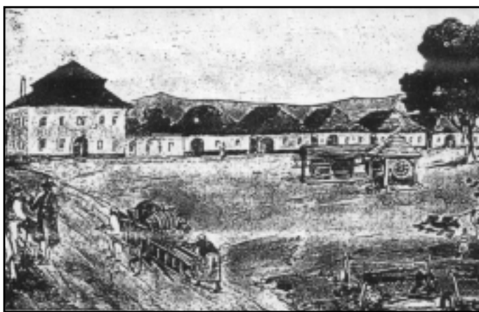
Pohled na staré náměstí