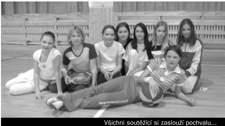
Všichni soutěžící si zaslouží pochvalu...