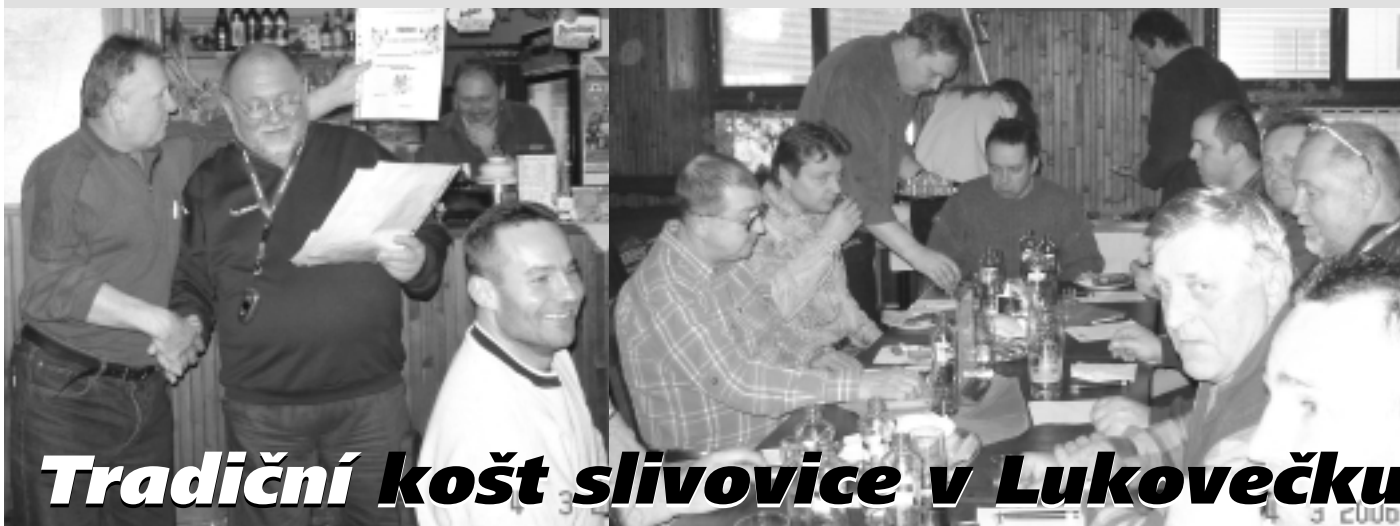
Tradiční košt slivovice v Lukovečku

Ale ať už byly výsledky jakékoliv, všichni odcházeli jako vítězové. SV