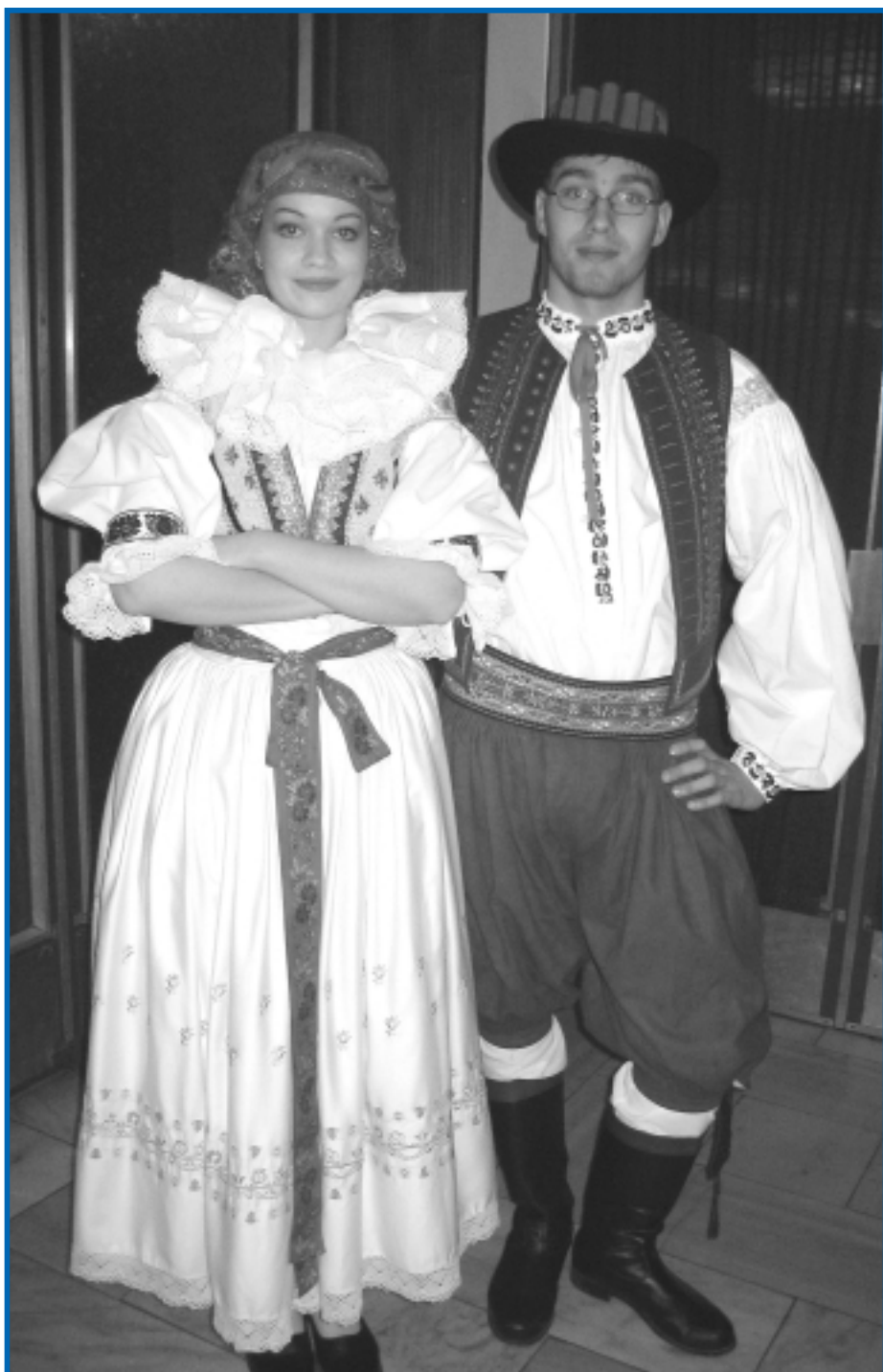
Martinská omladina na Valašském setkání ve Fryštáku

vydává Město Fryšták • ročník XVI • číslo 4 • duben 2006 • cena 5 Kč