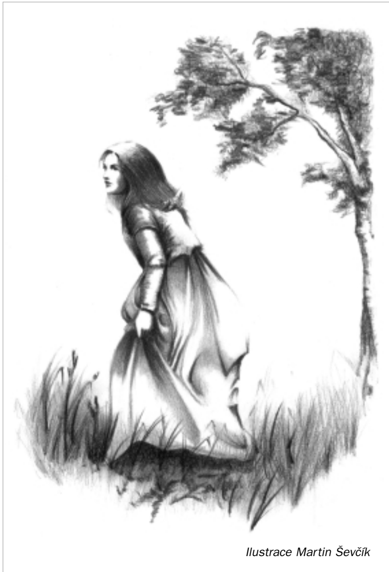
Ilustrace Martin Ševčík

Kupec Januška si na chvíli oddechl, jakoby ze sebe chtěl setřást jho jakési: „A protože se nám děvče svěřilo, že v čas moru rodičů svých v Opavě pozbylo a vy-