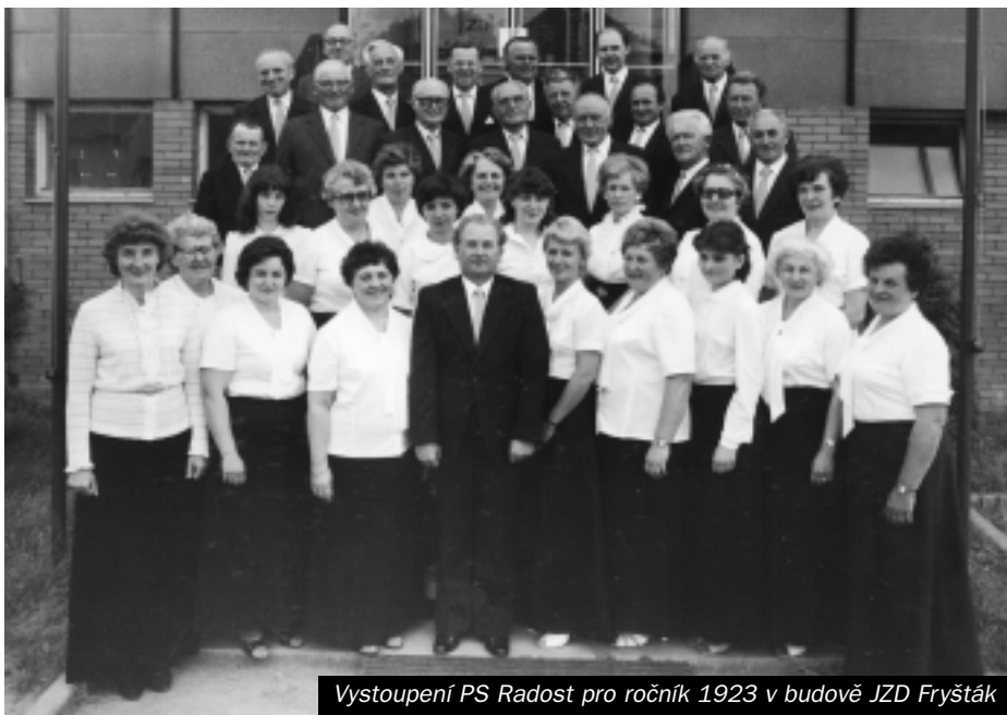
Vystoupení PS Radost pro ročník 1923 v budově JZD Fryšták

V letošním roce si členové Pěveckého souboru „Radost“ z Kostelce - Štípy připomínají 25 let činnosti svého spolku.