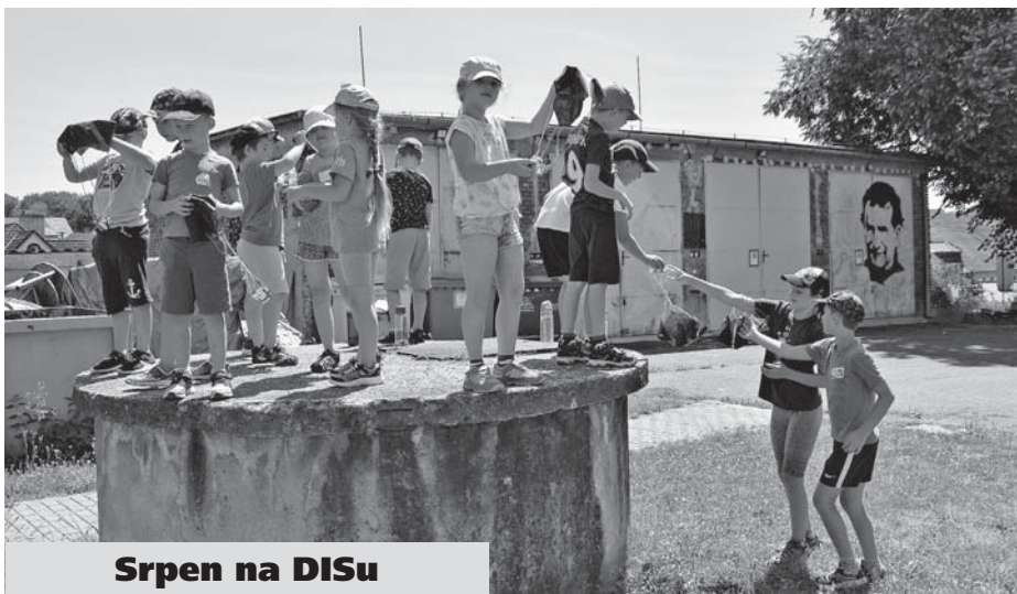
Srpen na DISu

V prvé řadě proběhly další příměstské tábory: Již 1. 8. začal pětidenní příměstský tábor „tvořivý“ na kterém si děcka vyzkoušela svou kreativitu: Vyráběly náramky, malovaly obrazy, hrnečky zdobily ubruskovou technikou a seznamovaly se s pedikem (pletení košíků). Na DISu nám v ateliéru zůstaly krásné výkresy, malovaná sklíčka a plovcí svíčky. Sportovní tábory byly nabité hrami a soutěžemi. Horku účastníci vzdorovali naplněnými balonky s vodou. Konaly se také pobytové tábory na Zikmundově a na Vidči. Abychom dosáhli plného výčtu táborů, proběhl také pobytový Horotábor a příměstský horotábor. A aby toho nebylo k horolezení málo, v srpnu se také rekonstruovala horostěna na DISu. Nejprve se umývaly chyty a poté se přestavovaly lezecké cesty. Posledních 14 dní zabraly na DISu rodinné dovolené, které vystřídal tradiční festival Fryštácký malý svět, plánování salesiánské provincie a setkání salesiánských dobrovolníků ze Zlína. Léto, budiž pochváleno!