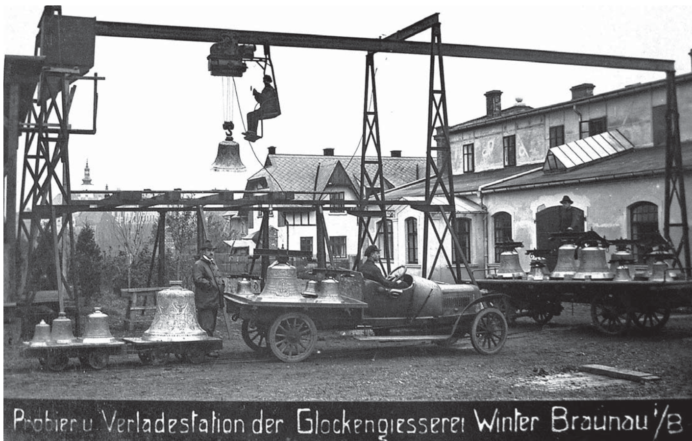
Probier u Verladestation der Glockengießerei Winter Braunau/8

dů. Produkce firmy byla skutečně velká a zvonařna byla počítána mezi přední západoněmecká zvonařství. Winter měl jistě opět mnoho zakázek díky druho-válečným rekvizicím. Ve strasserských závodech bylo zaměstnáno 120 lidí, z toho téměř 90% tvořili vyhnanci. V jednom novinovém článku z roku 1951 se vyskytuje věta: „Od onoho 1. 5. 1949 dodnes (tedy zhruba prosince 1951) odlila firma 1.953 zvonů o celkové váze