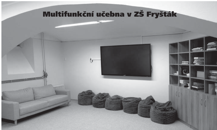
Multifunkční učebna v ZŠ Fryšták

Mnozí z vás, kteří jste navštívili základní školu ve Fryštáku si možná vybavíte suterénní prostory pod hlavním schodištěm staré budovy, které v minulosti byly využívány jako sklad civilní obrany, pionýrská klubovna nebo také jako třída pro výuku dětí z Hrádku. Na schůzkách školního parlamentu se zrodila myšlenka tyto prostory nově využít pro potřeby žáků a výuku netradičním stylem. Prostory byly nově vymalovány, byl položen nový koberec, pořídili jsme nový nábytek na uložení učenicích a výtvarných potřeb. K sezení slouží pohodlné sedačky a sedací pytle. Dominantou učebny je velkoplošná dotyková televize s připojením k PC a internetu.