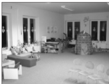
Prostory přístavby mateřské školky