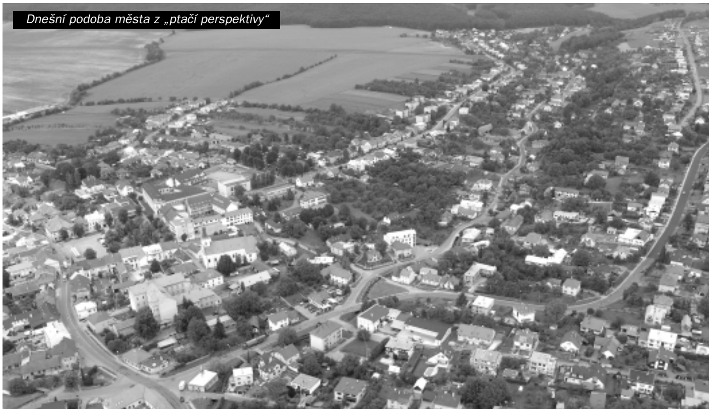
Dnešní podoba města z „ptačí perspektivy“