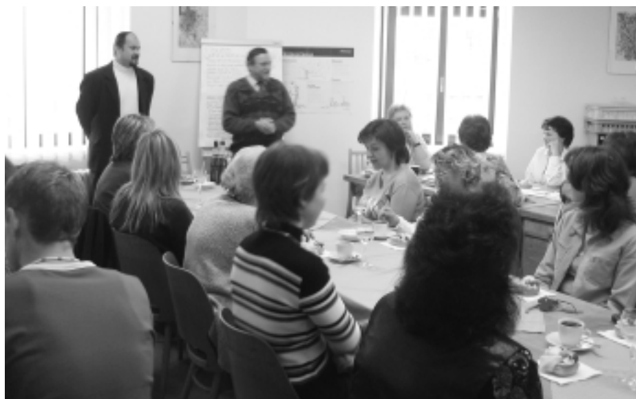
Starosta města blahopřeje ve fryštské základní škole ke Dni učitelů