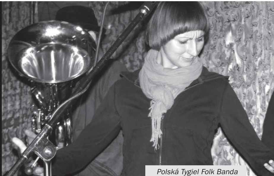
Polská Tygiel Folk Banda

Atmosféra byla milá a rodinná. Kromě ‚dospěláků‘ se programu účastnily také děti, pro které bylo v sobotu připraveno loutkové divadlo holešovského souboru Hvízd. V průběhu celé akce probíhal žonglovací workshop, otevřen byl bazárek, sekáč a nechybělo chutné občerstvení.