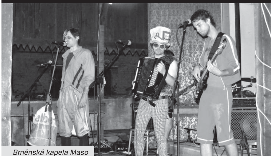
Brněnská kapela Maso

Druhým důvodem k těšení mi potom byla svobodně si Evropou létající Tygiel folk banda (PL). Už když jsem je zaslechl zkoušet pár hodin před vystoupením v čajovně, přimrazilo mě to... Instrumentace a zpěv, z kterých cítíte niternou radost. Mnoho nástrojů, hlasy si rostou podle pocitu, písně nabývají na koncertech pokaždé nových obrysů. S nimi si připadáte jako mořeplavci objevitelé a rozhodně ne pouze proto, že by se jejich produkce dala označit jako world music... Neváhejte ochutnat! http://www.myspace.com/tygielfolkbanda