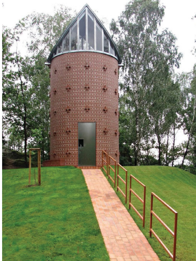
Kaple sv. Antonína z Padovy na Skalce

"Pane Ježíši, jsem odhodlán následovat tě třeba do vězení nebo na smrt, abych obětoval svůj život pro tebe, neboť tys přinesl v oběť svůj život pro nás."