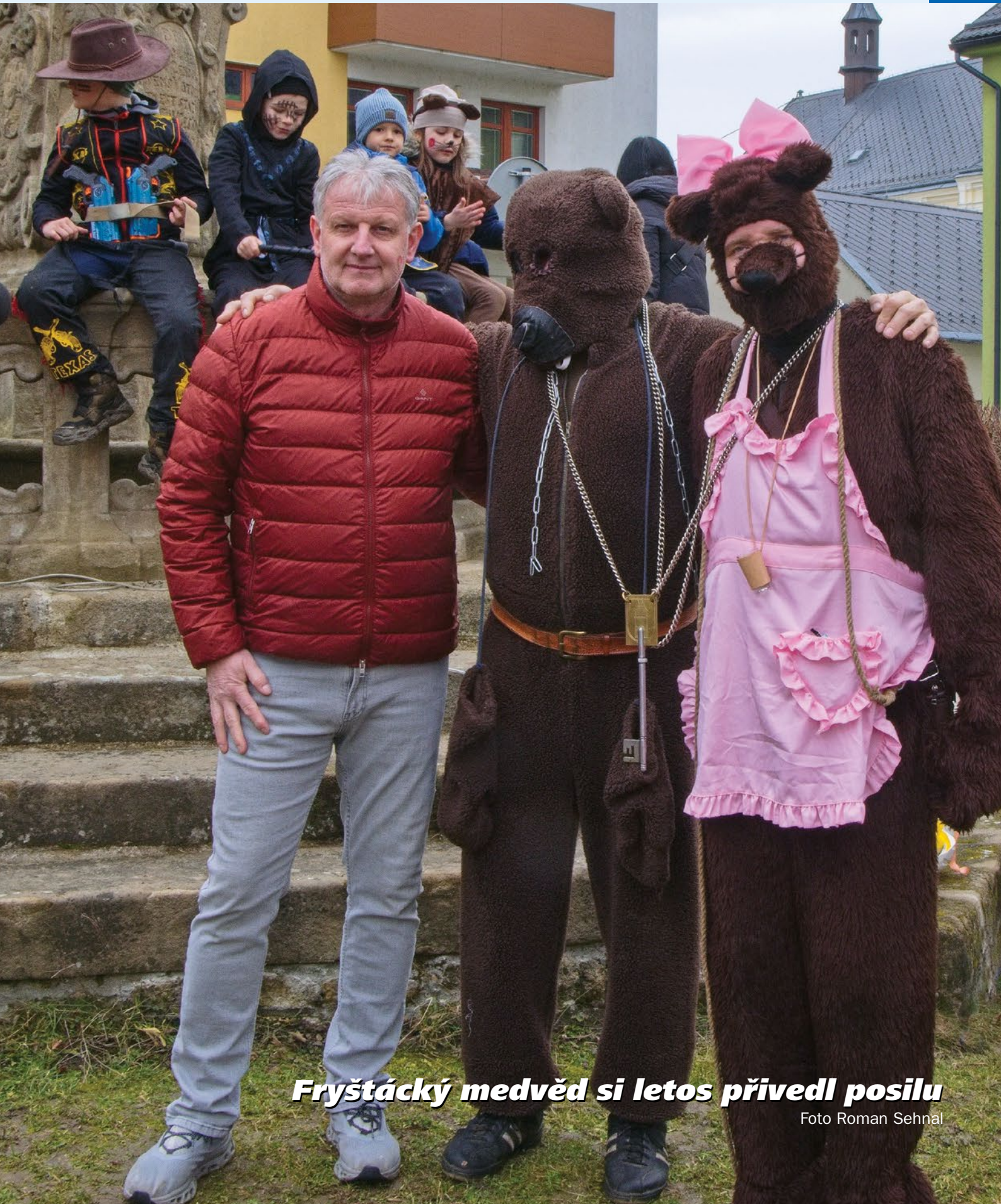
Fryštácký medvěd si letos přivedl posilu