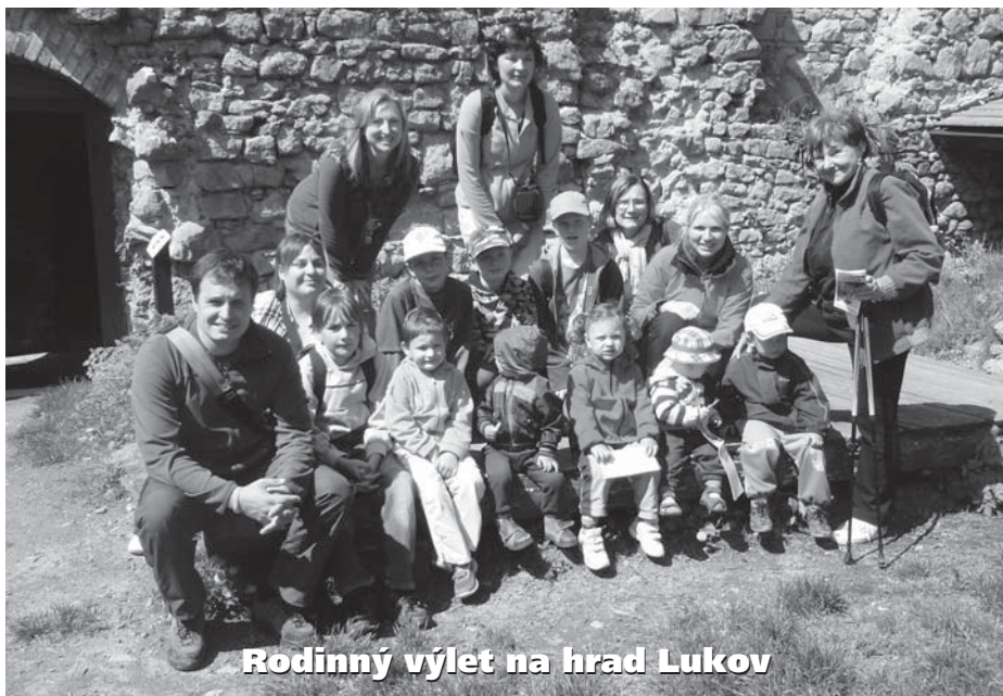
Rodinný výlet na hrad Lukov

22. 6. (pátek) od 16 hod Patchwork s Hankou Svačinovou, potřeby na kurz: šicí stroj, látky, šicí potřeby.