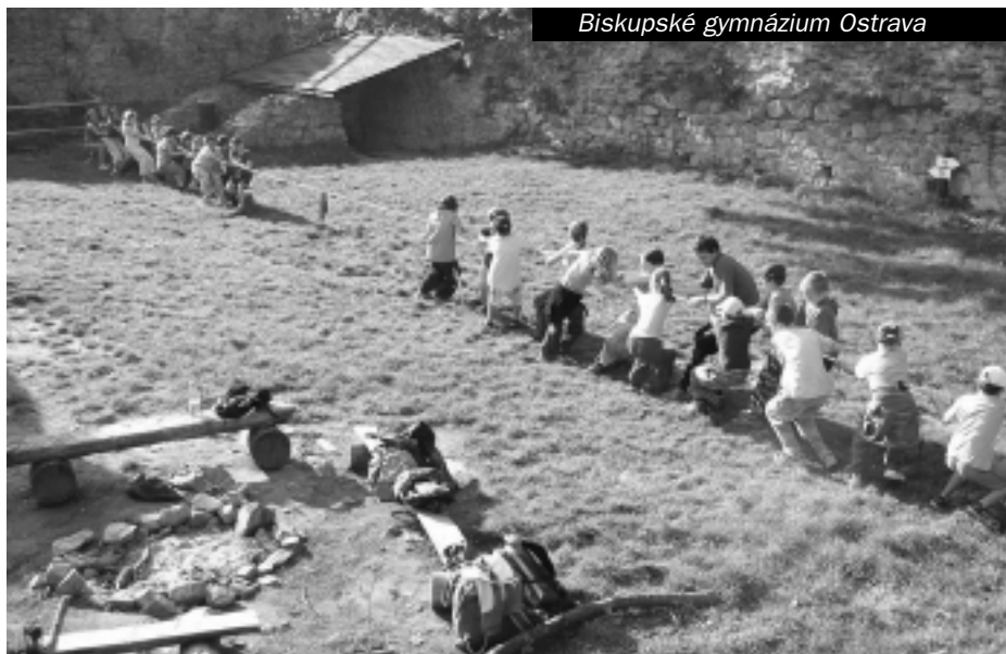
Biskupské gymnázium Ostrava