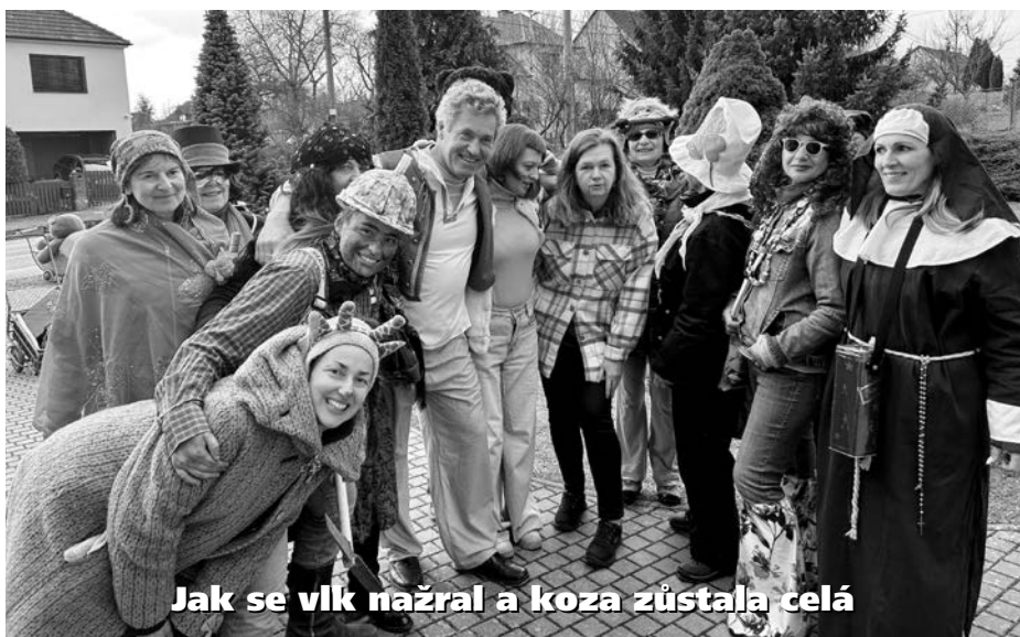
Jak se vlk nažral a koza zůstala celá