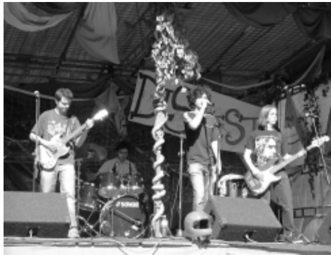
Skupina Widle 24 hodin na střeše (vlevo) Studení posluchači (dole)