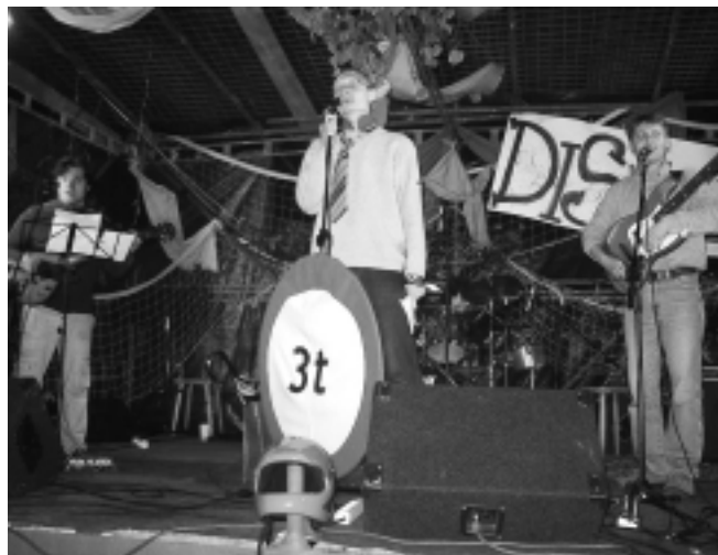
Skupina 3 tuny

Zároveň s tímto festivalem byla i poslední 24 hodinovka, tentokrát na střeše. Škrabali, brousili a natírali jsme velkou střechu na DISu. Udělalo se kus práce, která je vidět široko daleko. Ještě uvažujeme, když je to velká plocha, co s ní?