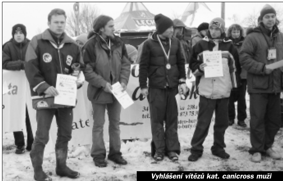
Vyhlášení vítězů kat. canicross muži

Nedaleko od Wadowic v obci Wysoká se konal již 10. ročník těchto závodů. Z účasti v minulých ročnících jsem byl mezi favority, to se nakonec také potvrdilo získáním prvního místa a trofeje "O Zloto but". Zatím jsem spokojen s průběhem této sezóny. Dává mi to naději a sílu do dalších závodů kde