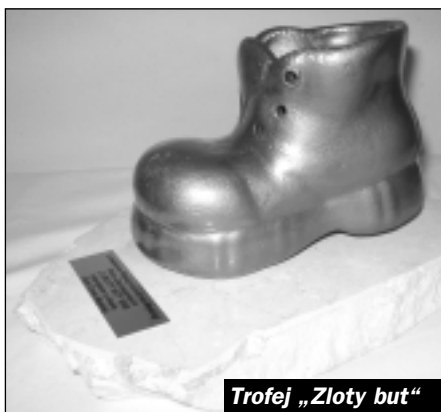
Trofej „Zloto but“

S příchodem zimního období pro nás začala nová závodní sezóna. Se svým čtyřnohým týmem jsem se zúčastnil závodů v Trnávce okr. Nový Jičín, kde se nám podařilo obsadit 2. místo a další závod následoval v Cakově - Nové Dvory. Zde jsme zvítězili a to posílilo rozhodnutí vydat se na Mezinárodní závody do Polska.