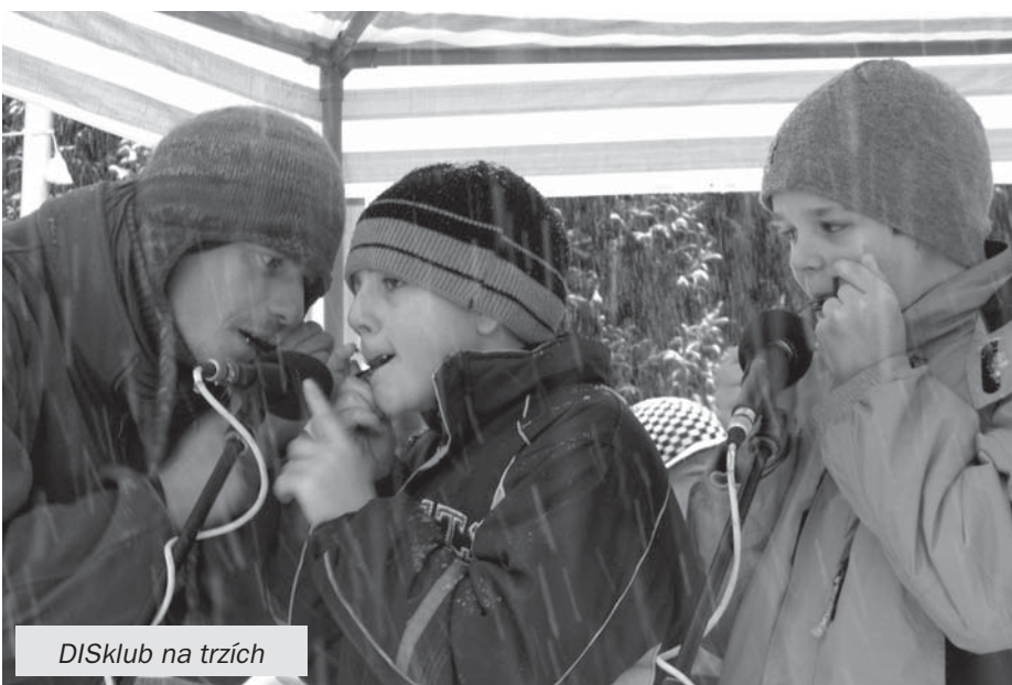
DISklub na trzích

Prodej a rezervace vstupenek pouze do 12. ledna, po tomto termínu se dají do volného prodeje. Víte, že se k nám mnoho lidí nevejde, proto neváhejte!!!